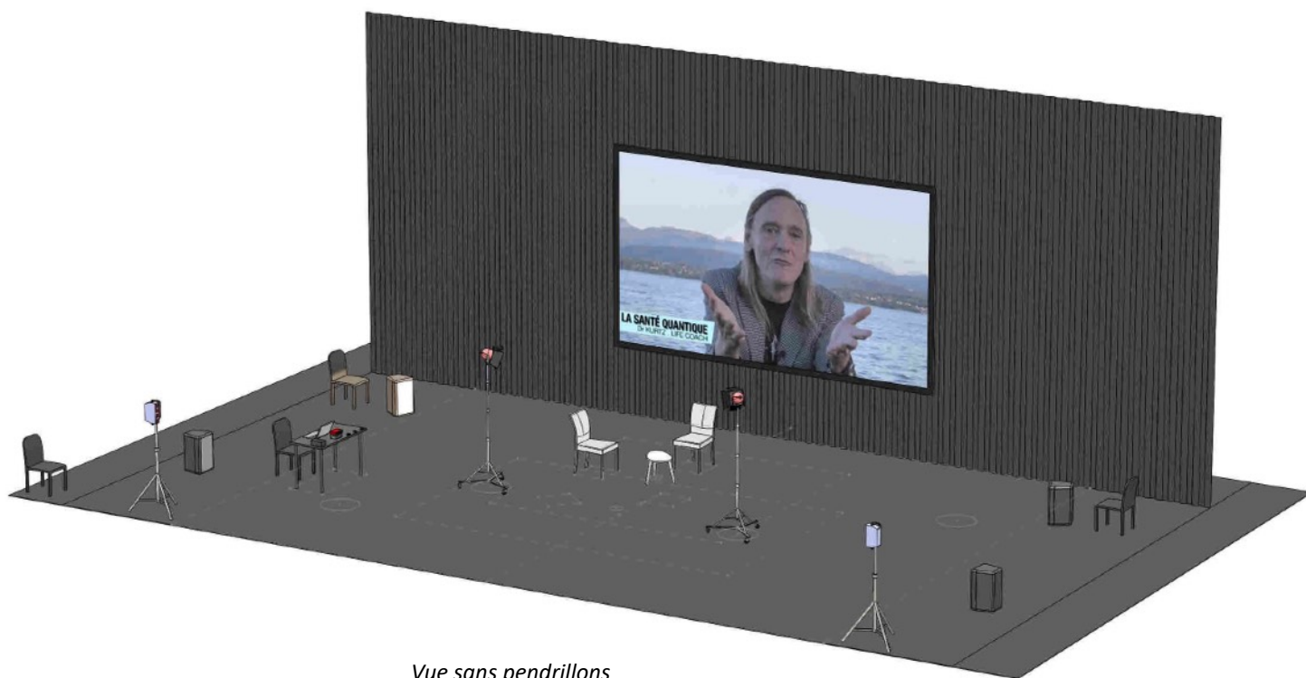
Vue sans pendrillons